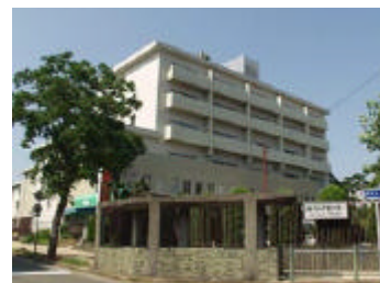
長崎カトリックセンターYH