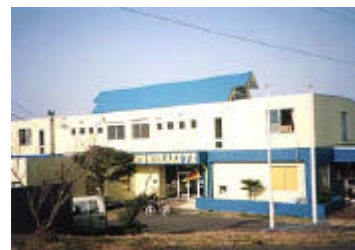
五島三井楽サンセットYH