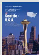
Hostelling Magazine×地球の歩き方... P12 アメリカ西海岸シアトルで大人の社会科見学 ボーイング社/アマゾン・ドット・コム/ スターバックスコーヒー ■Seattle 2Days BEST PLAN