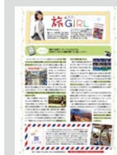
教えて! 旅GIRL ..... P22