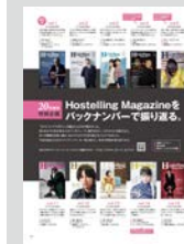
20号発刊特別企画 ..... P20 Hostelling Magazineを バックナンバーで振り返る。