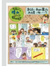
松島むうの晴れときどき旅びより ..... P23