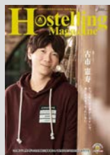
Hostelling Magazine vol.20 まとめてダウンロード