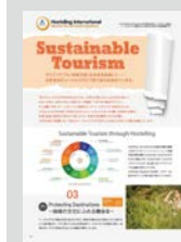
Sustainable Tourism ..... P18