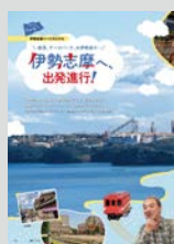
Youth Hostel Pick up ..... P08 伊勢志摩へ、出発進行! 伊勢志摩ユースホステル