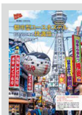
Youth Hostel Pick up ..... P08 都市型ユースホステル だからこそ快適性を追求し続ける 新大阪ユースホステル