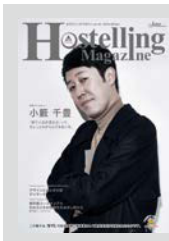
Hostelling Magazine vol.19 まとめてダウンロード