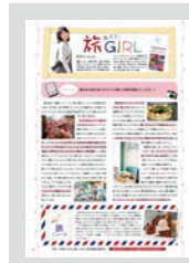
教えて! 旅GIRL ..... P20