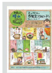
松島むうの晴れときどき旅びより ..... P21