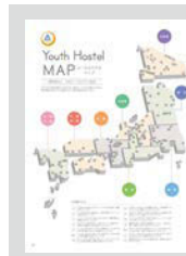
Youth Hostel MAP ..... P22