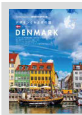
Hostelling Magazine × 地球の歩き方... P12 デザインとおとぎの国デンマーク ■おとぎの国の首都コペンハーゲンを歩く ■コペンハーゲンのデザインスポット巡り ■おいしいデンマーク