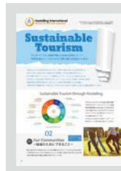
Sustainable Tourism ..... P18